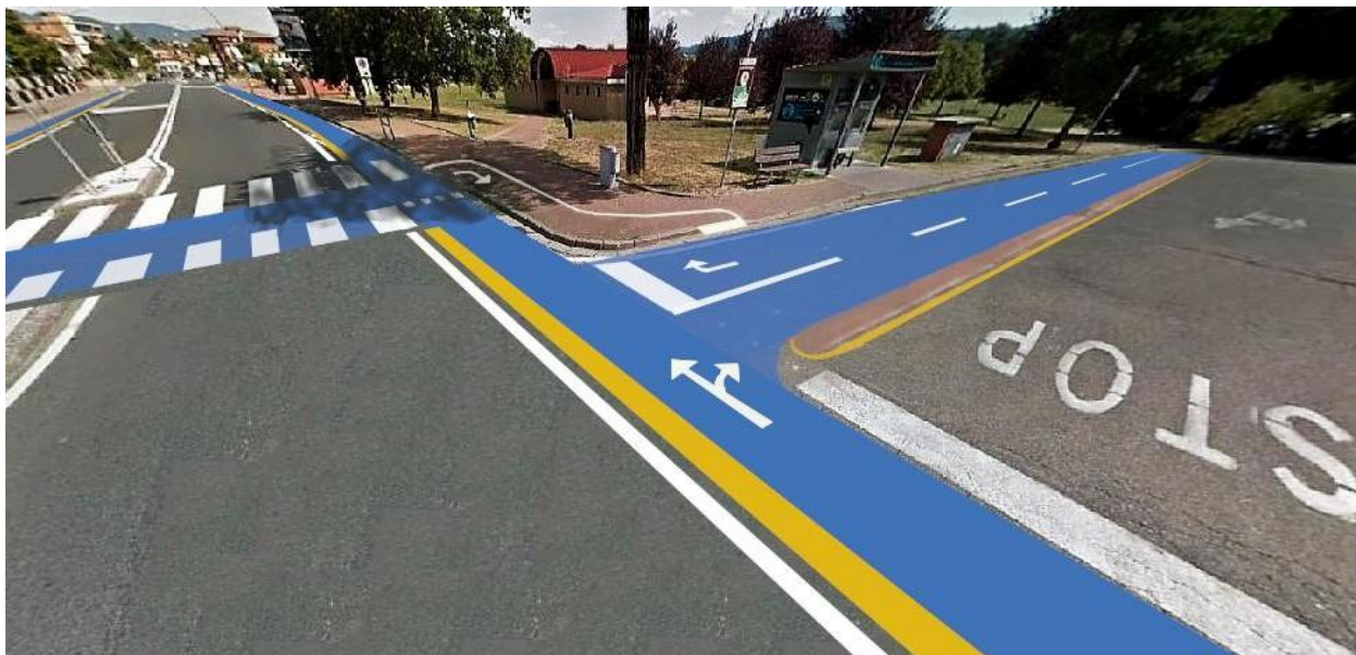
Foto ricostruzione del collegamento tra il Parco della Misericordia e Viale della Resistenza; si noti in particolare il breve tratto ciclabile monodirezionale tracciato sul marciapiede al fine di collegare l'attraversamento pedonale alla bidirezionale diretta al Parco