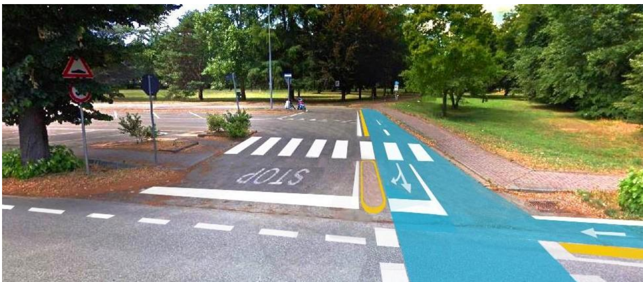
Foto ricostruzione del collegamento tra il Parco della Misericordia e Viale Giovanni XXIII

L'intervento qui sopra descritto è altresì compatibile con le previsioni del Biciplan in merito al collegamento ciclabile dell'area di servizi di Piazza M. L. King, su cui è già stata presentata dall'Associazione A Ruota Libera una proposta preliminare, la quale verrà dettagliatamente sviluppata e descritta in un documento dedicato.