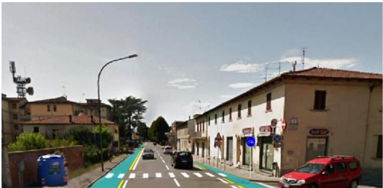
Foto ricostruzione del Viale Giovanni XXIII dopo l'inserimento delle corsie ciclabili

La sezione del Viale Giovanni XXIII non è costante, restringendosi (nel tratto compreso tra Via dei Medici e il parcheggio del Parco) fino a un minimo di 9,30 metri. Considerando che la regolarità e la sezione delle corsie carrabili sono considerate uno strumento fondamentale per la moderazione della velocità, si raccomanda di tracciare corsie carrabili di larghezza costante pari a 3,00 metri (o eventualmente 3,25 metri), affiancate da corsie ciclabili di larghezza variabile, da un minimo di 1,50 metri.