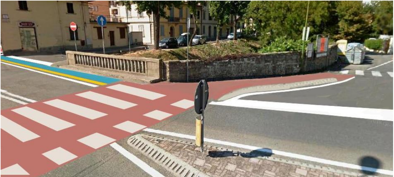
Foto ricostruzione del nuovo attraversamento ciclo pedonale sul Ponte Rosso